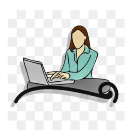
All are cordially invited